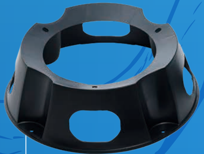
■ Base de Réservoir Fixe 14 / 40