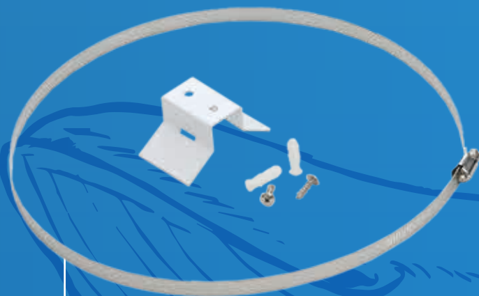
■ Support Mural pour Réservoir Sous Pression