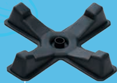
■ Pied en Forme de Croix

Accessories-Plus offre une excellente expérience d'installation pour l'installateur. Chaque pièce est conçue en fonction de l'expérience réelle de remplacement sur le terrain. Accessories-Plus rend l'installation efficace.